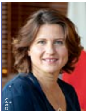
Roxana Maracineanu Ministre des Sports

Le sport est à la fois un enjeu et un symbole. Un enjeu de santé, de bien-être, d'éducation, de cohésion sociale mais aussi un symbole de liberté.